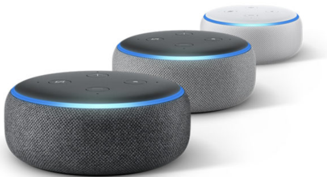
Amazon Echo Dot 3.generace

Amazon Alexa je virtuální asistent vyvíjený společností Amazon, který byl poprvé použit v chytrém reproduktoru Amazon Echo. Tento asistent dokáže za pomoci vašeho hlasu nastavovat různá upozornění, pouštět hudbu a poskytovat základní informace (počasí, doprava a mnoho dalších). Opět může být využit jako ovládací prvek domácnosti, který zajišťuje automatizaci inteligentních zařízení. Alexa může být rozšířený pomocí doplňujících balíčků od třetích stran.