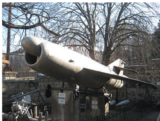
Foto: Raketa KSS z expozice muzea Černomořské flotily v Sevastopolu