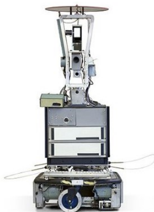
Obrázek 1: Shakey the robot