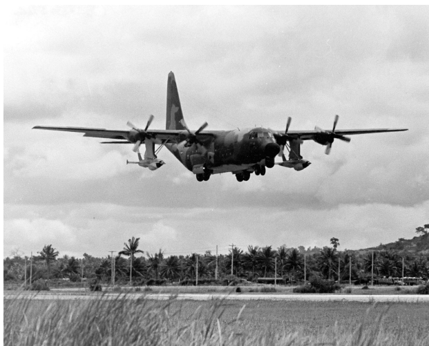
Obrázek 7: Lightning Bug

Většina průzkumných misí však byla provedena pomocí letounů Lightning bug. Ty byly vytvořeny jako nástupní letouny po jednom z modelů Firebee, který se jmenoval Firefly. Jednalo se o subsonický bezpilotní letoun a bylo vyrobeno více než 20 jeho verzí.