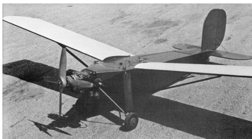
Obrázek 4: Radioplane OQ-2

Jeden z prvních objevů války byl jednoznačně Radioplane OQ-2, který vznikl díky úspěšnému Hollywoodskému herci Reginaldovi Dennymu. OQ-2 startoval z katapultu a byl řízený ze země pomocí ovládacího panelu. Byl vyvinut společností Radioplane, která v roce 1940 získala armádní zakázku na sériovou výrobu letounu. Jeho motor se skládal z dvoutaktního dvouválce, který byl chlazený vzduchem. Dokázal dosáhnout rychlosti 90 mp s maximální výškou letu 8 tisíc stop. Po nějaké době se začal vyrábět i jeho nástupce OQ-3 a celkově se během války vyrobilo přes 15 tisíc kusů. Tento krok vedl k velkému zintenzivnění používání vojenských bezpilotních letounů.