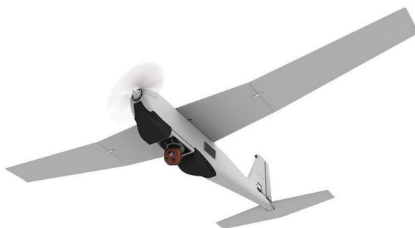
Obrázek 11: RQ-20A Puma