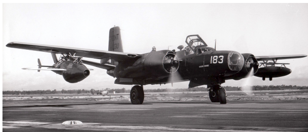
Obrázek 6: FireBee

V USA byl vyvinut letoun Ryan Firebee, známý také jako Q-2A. Byl to cílový dron poháněný proudovým motorem Continental J69-T-19. Do vzduchu byl z rampy odpálen pomocí pevného raketového mototru. Tento dron byl později upraven pro průzkumné mise. V základní verzi měl tento letoun dolet až 796 mil ve výšce 60 000 stop a létal s maximální rychlostí 690 mph.