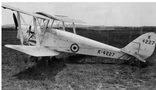
Obrázek 3: DH.82B Queen Bee

Trvalý význam měla až v roce 1933 bezpilotní varianta dvouplošníku de Havilland Tiger Moth. DH.82B Queen Bee způsobila revoluci ve vojenském cvičení. Letoun začal letát v roce 1935, kdy létal u královského letectva a námořnictva až do roku 1947. Queen Bee dokázala letět i ve výšce přes 16 000 stop, rychlostí 62 mph. Celkem jich bylo vyrobeno více než 400 kusů.