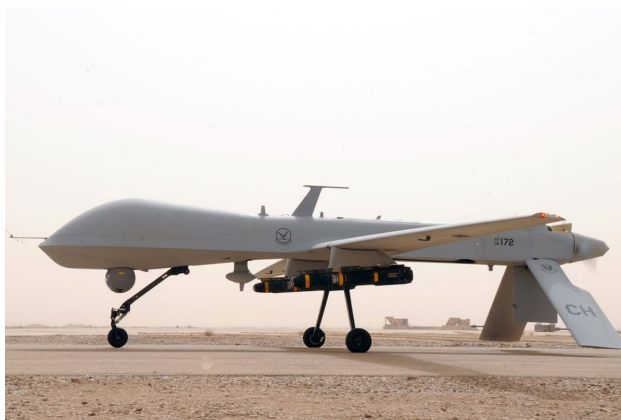
Obrázek 8: MQ-1 Predator

Zlomovým nástupcem se stal ikonický letoun MQ-1 Predator, který se stal prvním ozbrojeným bezpilotním letounem. Byl vybaven raketami Hellfire, které byly naváděny laserem, které měly vysokou přesnost, způsobily malé škody a byly schopné jak boje proti pancíři i proti lidem. Díky svému dlouhému doletu, širokospektrálním sensorům a přesným zbraním poskytoval jedinečnou možnost provádět koordinované údery nebo průzkum. Predator je vybaven systémem Multi-Spectral Targeting, který má infračervený senzor, barevnou/monochromatickou denní TV kameru, kameru s obrazovým zesilovačem a laserový zaměřovač.