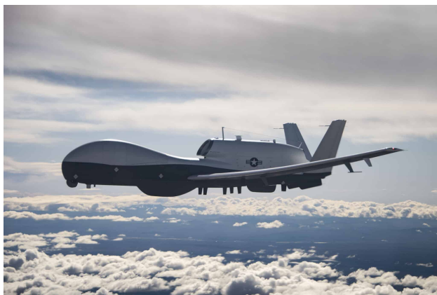
Obrázek 9: MQ-4C Triton

Jedná se například o letoun MQ-9 Reaper, který je vlastně jen vylepšenou verzí již zmíněného Predatora. Nejčastěji byl využíván v Iráku, Afghánistánu nebo Sýrii. Po incidentu 11. září se drony staly tváří jakékoliv Americké války. Podle US Department of Defense provedla CIA skoro 14 000 náletů dronů, které zabili tisíce lidí. Přesné množství obětí není známé, ale počet se pohybuje mezi 8 850 - 16 900. Zároveň byly drony považovány za hlavní prvek strategie k odstranění vedení Al - Káidy a ISIS. Nejmenším americkým bezpilotním letounem je RQ-11B Raven, který vlastní i Armáda ČR, dronům v České Republice se budu věnovat ve vlastní kapitole. Na druhé straně největším americkým bezpilotním letadlem je RQ/MQ-4 Global Hawk/Triton, který váží více než 32 000 liber.