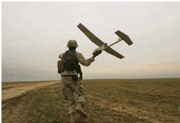
Obrázek 10: RQ-11B Raven

Nejdůležitějším je už zmíněný RQ-11B Raven. Jedná se o taktický letoun s kevlarovým pláštěm, které mají jak autonomní tak i manuální ovládání. Díky optickým přístrojům, dokáží přenášet obraz v reálném čase. Jsou poháněny tichým elektromotorem a jsou vybaveny laserem, který umožňuje letouny navádět k cíli. Hlavní výhodou je možnost jeho startu, díky své velikosti ho pouze stačí hodit z ruky. Váží necelých 4,5 liber a má rozpětí 4,2 stop. Jeho dolet je 6 mil a vydrží letět přibližně 80 minut s rychlostí až 60 mph.