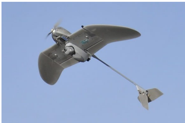
Obrázek 12: Wasp III AE

Malý americký letoun Wasp III je schopný poskytovat velitelstvu přímé informace o cílech v reálném čase. Spadá do třídy malých bezpilotních letounů známých jako mikro UAS. Jedná se o skládací dron s dvou listovou vrtulí, která je poháněna malým elektromotorem. Má svůj vlastní systém GPS, inerciální navigační systém, autopilota a dvě kamery (denní i noční režim). Je využíván převážně k průzkumným misím v malých výškách, přibližně 150 - 500 stop. Rozpětí křídel má přibližně 2,3 stopy a letá rychlostí až 40 mph.