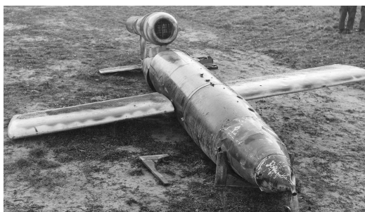
Obrázek 5: V-1 Flying bomb

Nejničivější letoun však byl vyroben v Německu, jednalo se o létající bombu V-1, které se říkalo "Doodlebug". Byl to vlastně přetvořený model amerického Ketteringova brouka. Jedná se o první operační řízenou střelu. Tento bezpilotní letoun dokázal letět více než 150 mil a létal s rychlostí 248 mph. V roce 1944, kdy Německo útočilo na Londýn, vypustilo i více než 100 bezpilotních letounů denně. Je možné, že tento krok vedl Brity k vytvoření jedné z prvních protiletadlových technologií. Na konci války byla v Německu představena první řízená balistická střela dlouhého doletu. Raketa V-2 byla první raketa na kapalné palivo a byla odpalována z mobilních plošin. Pohybovala se rychlostí blízkou rychlosti zvuku, takže byla skrytější a nebezpečnější než V-1. Během let 1943 - 1945 bylo vypuštěných více než 3000.