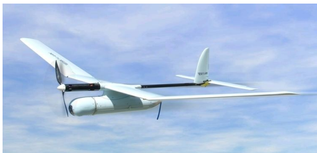
Obrázek 13: Elbit Skylark I - LEX

Jedná se o letoun Izraelského původu, který se řadí mezi vysoce utajené prostředky ISR. Dokáže poskytovat video ve vysokém rozlišení v reálném čase a je plně autonomní od vzletu až do přistání. Jeho pokročilé funkce zpracování obrazu zahrnují např. indikátor pohyblivých cílů nebo georegistraci.