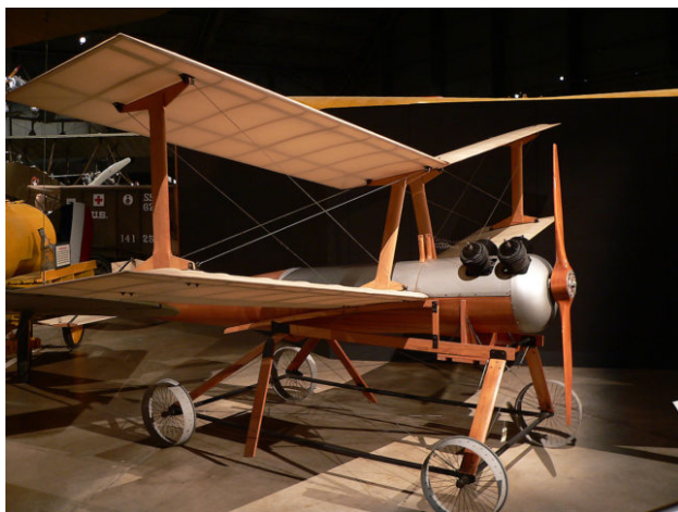
Obrázek 1: Kettering Bug

Kettering bug byl 12 stop dlouhý dřevěný dvouplošník, který měl rozpětí křídel skoro 15 stop. Včetně téměř 82 kilové bomby vážil pouze 240 kilogramů. Motor byl vyrobený společností Ford, jako čtyřválec měl výkon 40 koní. Jeho úkolem měly být přesné útoky na nepřátelskou obranu. Tento dron fungoval na relativně jednoduchém mechanismu, kdy po určení rychlosti, směru větru a požadované vzdálenosti byl vypočten počet otáček motoru, které byly potřebné k tomu, aby se Brouk dostal k cíli. Celkem bylo vyrobeno přibližně 50 těchto typů, válka ale skončila dříve, než mohli být Brouci vypuštěni. Podle dnešních měřítek má Kettering bug blíže k řízené střele než k bezpilotnímu letounu, ale i přesto byl zásadním krokem pro další vývoj bezpilotních letounů.