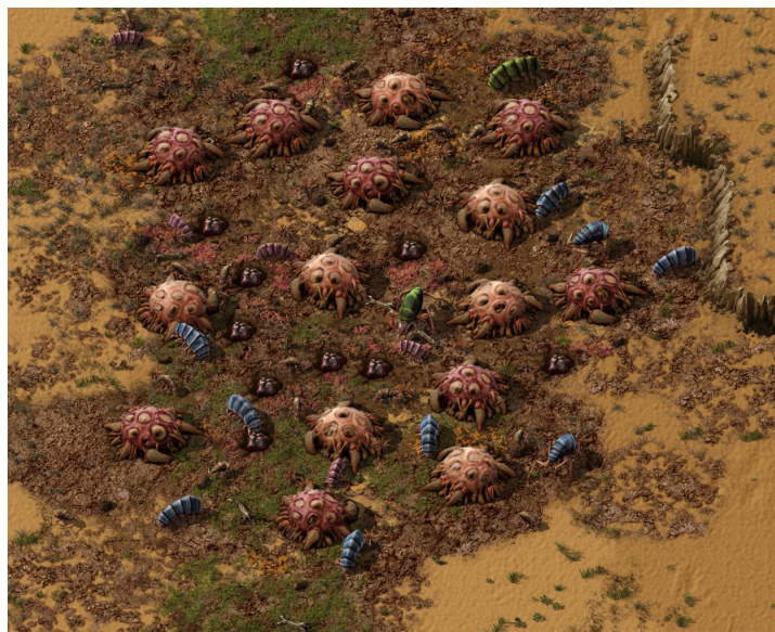
Obrázek 3: Hnízdo „ kousáči “ [3]