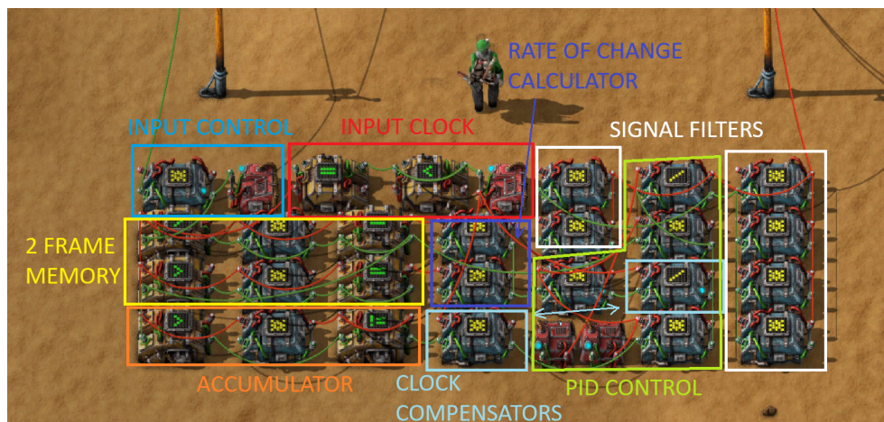
Obrázek 2: Návrh PID regulátoru ve hře Factorio [2]

binátorů. Ve hře se nachází tři a to aritmetický, rozhodovací a konstantní. Zpracovaný signál lze přivést zpět na jednotlivé díly, a tím je ovládat. Třeba v případě přepravního pásu ho lze zapnout a vypnout.